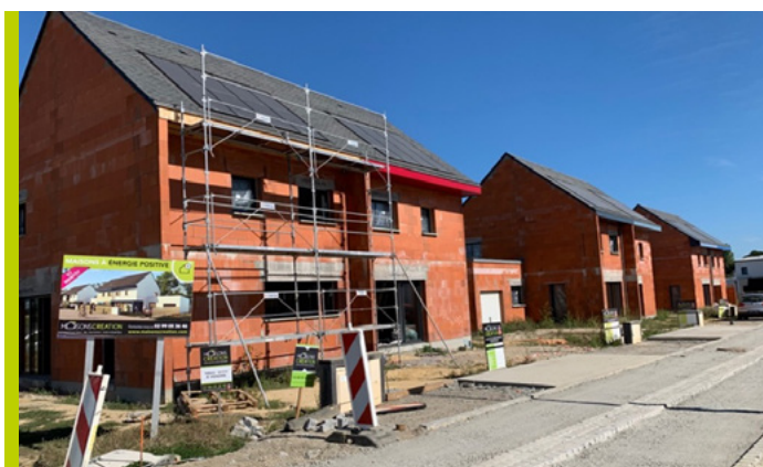
Maisons en cours de construction