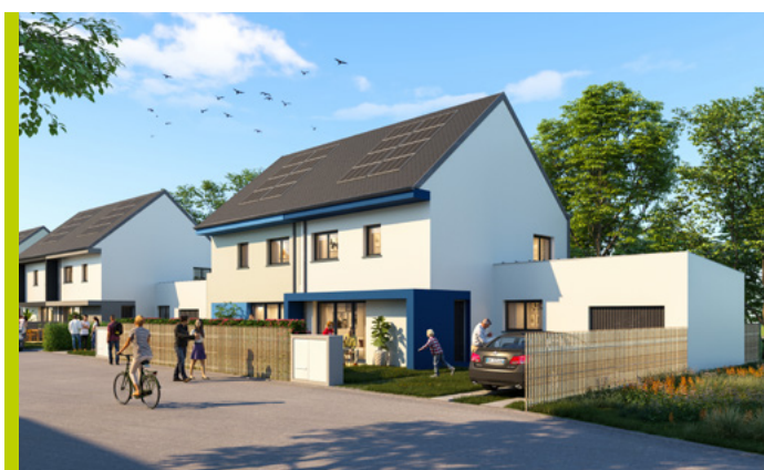
Perspective d’une maison à énergie positive au Rheu

Plusieurs villes dont Montgermont récemment, ont également décidé de faire confiance à Maisons Création, afin de proposer cette offre à ses habitants.